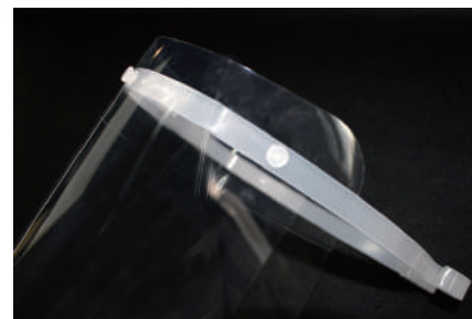
(4) 保護フィルム剥離面を外側にした状態でフレーム突起部にフィルム穴部を4ヶ所通してフェイスガードを組み立てる