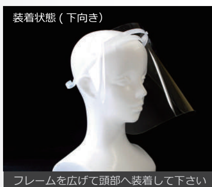
※フレームが緩く感じる場合、フレームの後頭部側に輪ゴム等をかけるとフィットします